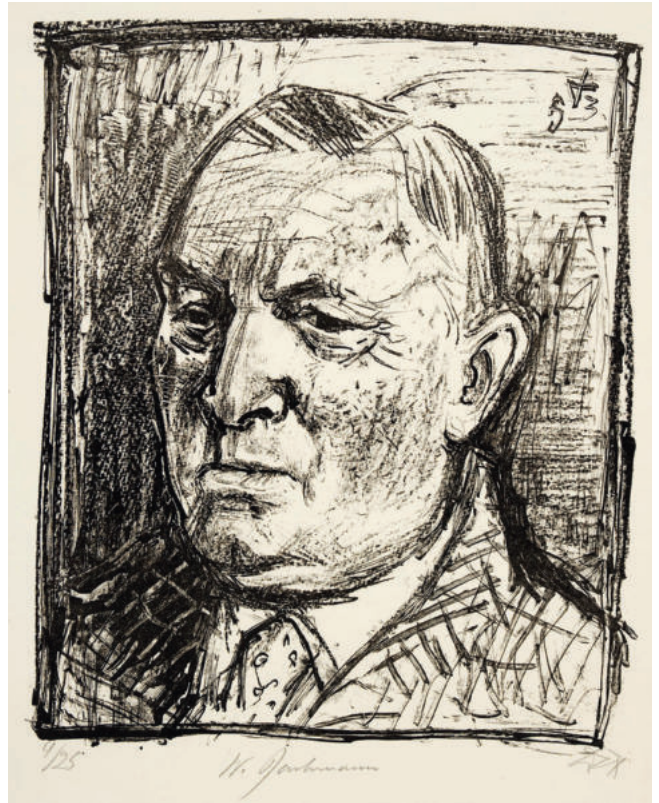
Abb. 1. Porträt Walter Bachmanns aus dem Jahr 1953 (* 1883, † 1958).

ner durch Transkript, Übersetzung und kritischen Anmerkungen besonders minutiösen Quellenherausgaben 1963 in den Arbeits- und Forschungsberichten Dresden (Ludwig 1963). Während E. Pietsch erst die in der Urkunde von 1244 geregelten Besitzwechsel als Grundlage für den Bau des Schlosses der Vögte ansah (s. o.), kam W. Ludwig durch philologische Mittel zu dem Schluss, dass das 1224 erwähnte „castrum“ erst kurz vor Ausstellung der Urkunde erbaut worden sei und sich die Textstelle auf eben jenes Schloss über der Neustadt und nicht auf das „Alte Schloß“ an der Südostecke der Stadt bezöge (Ludwig 1957, 8, 40)